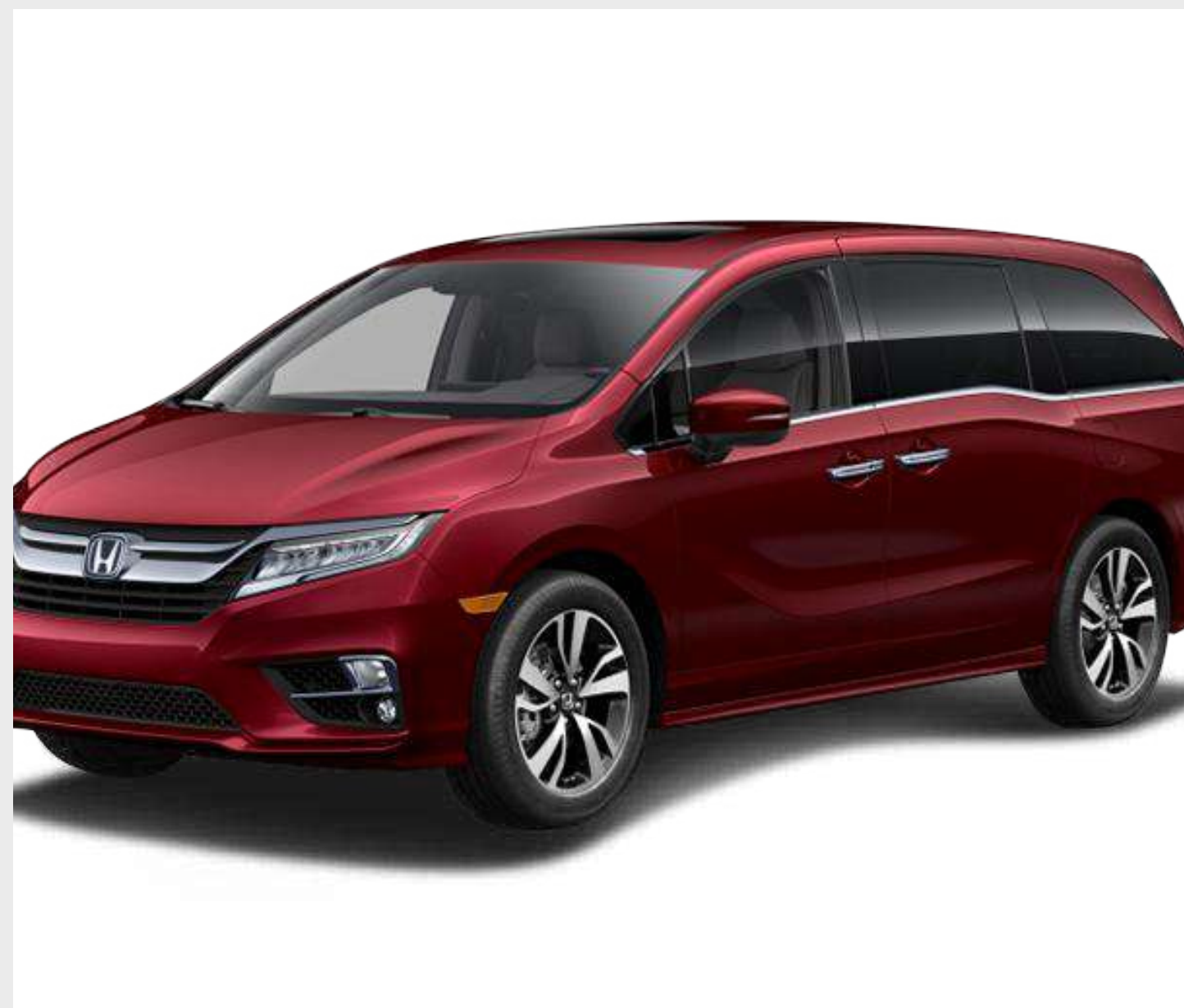
ROJO DEEP SCARLET