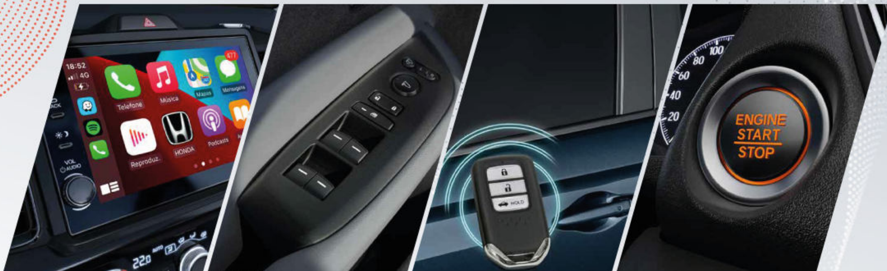
Pantalla táctil (8") con sistema de Android Auto y Apple Car Play