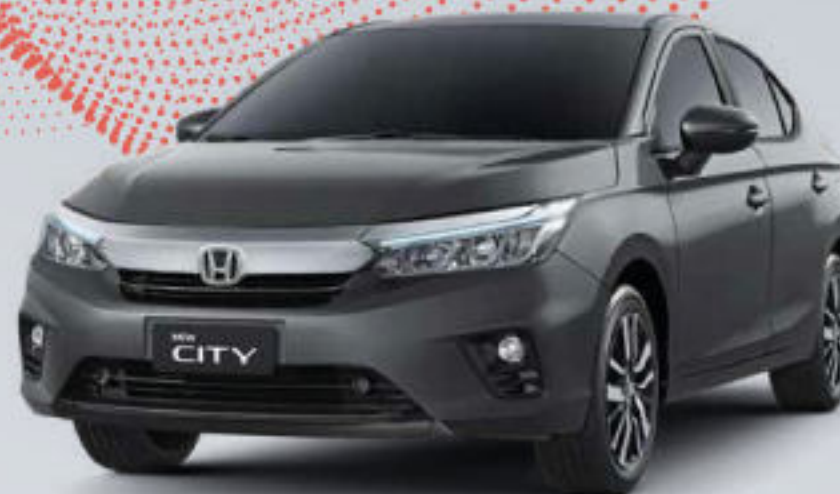
Modern Steel M.