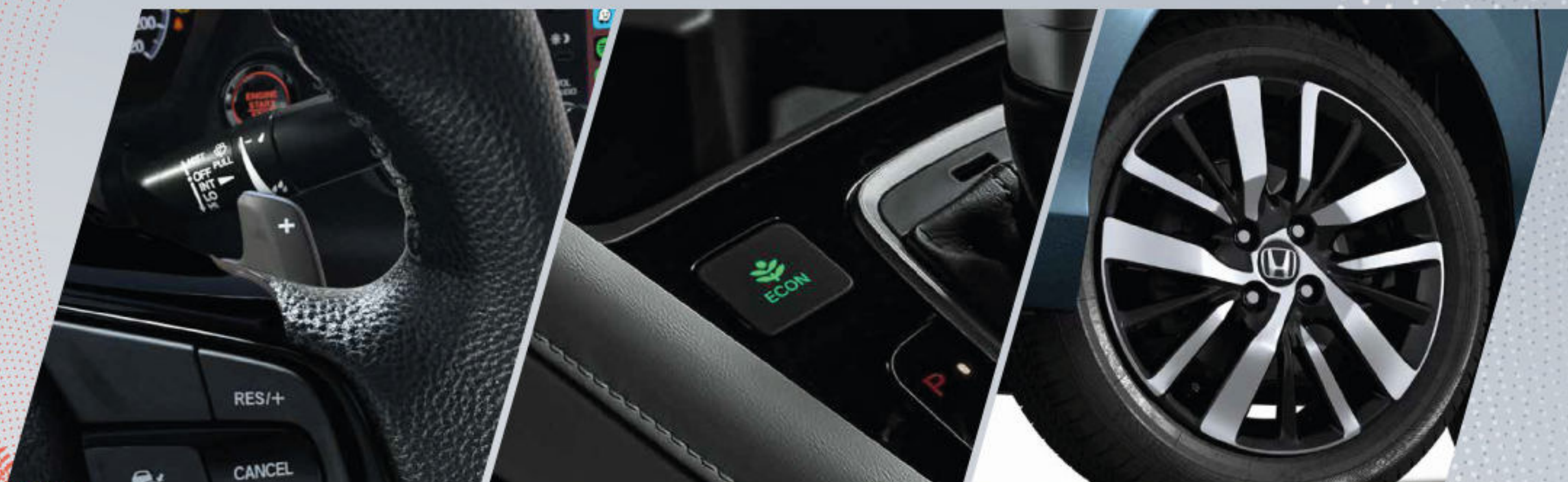
Paddle Shift Sistema de control de cambios de velocidad