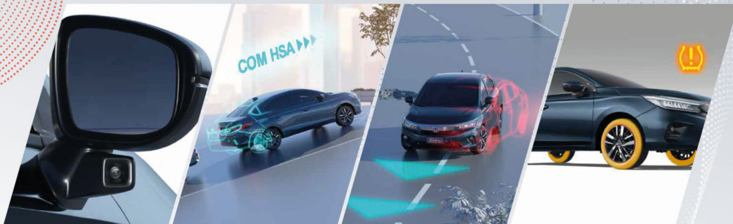
Honda Lanewatch Cámara de punto ciego