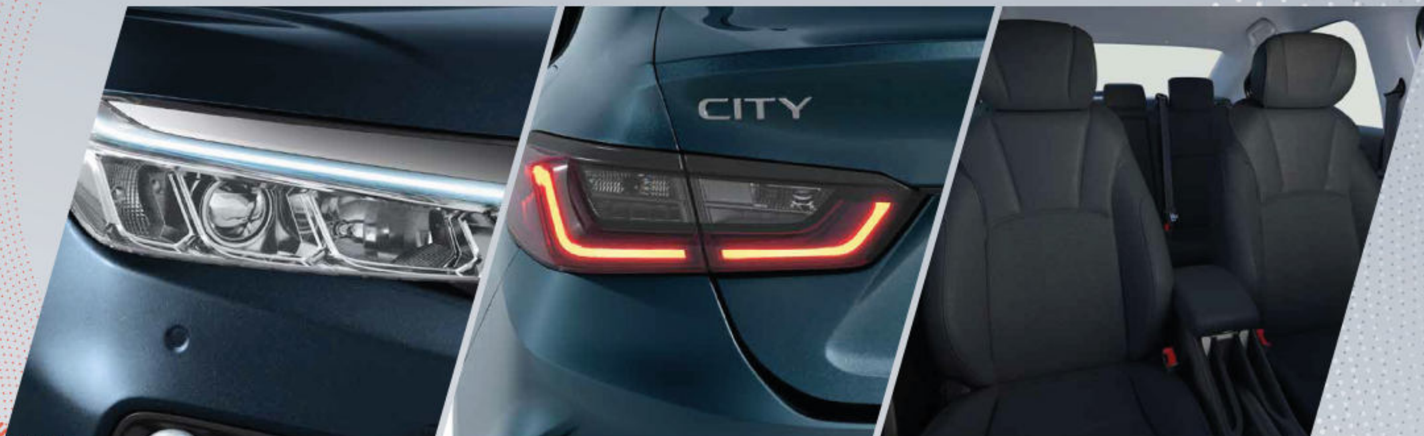
Luces diurnas LED